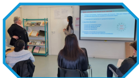
Atelier Savoir être - Savoir faire