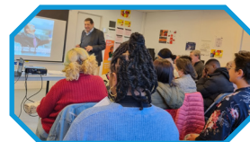
Atelier Confiance en soi