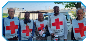
Action solidaire avec la Croix Rouge